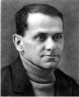
Pavel Blonsky (1884-1941). Ucraniano, participante de la lucha revolucionaria, fue el más destacado pedagogo y sicólogo de esta corriente. Se señala una amplia producción de más de 200 trabajo sobre psicología y educación. Fue el primer rector de la Academia de Formación Socialista (más tarde Academia N. Krúpskaya de Educación Comunista).

Para Blonsky, nuevamente se pone a la fábrica como el espacio educativo más idóneo para la formación polivalente, considerando que allí podrá ganar en disciplina, conciencia de sí mismo y un mayor nivel de libertad. Plantea estructurar el sistema a partir del jardín de la infancia, el “robinsoneo” en la colonia escolar, el internado de escuela de trabajo familiar y la escuela del trabajo para adolescentes ligada a la fábrica a través de una enseñanza interdisciplinar.