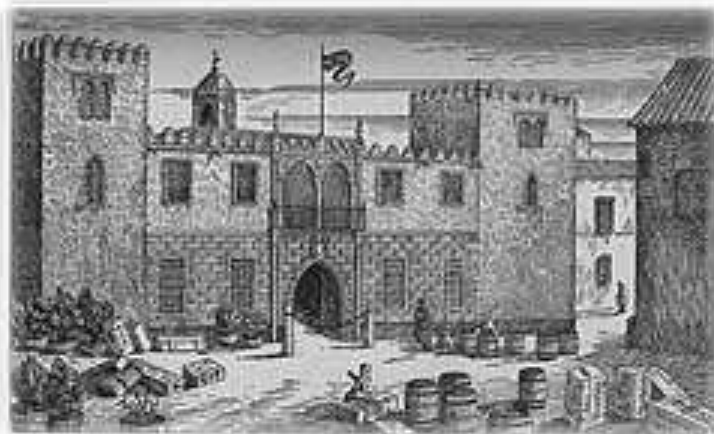
Antigua Casa de Contratación de Sevilla

Los comerciantes de las colonias rechazaban la política monopolista española y se oponían a pagar impuestos a la metrópoli, porque, aunque se beneficiaban del comercio mutuo, sufrían los miserables precios que aquella fijaba a sus exportaciones, y la prohibición de comerciar con otros países europeos deseosos de acceder a sus abundantes materias primas que la incipiente Revolución Industrial exigía.