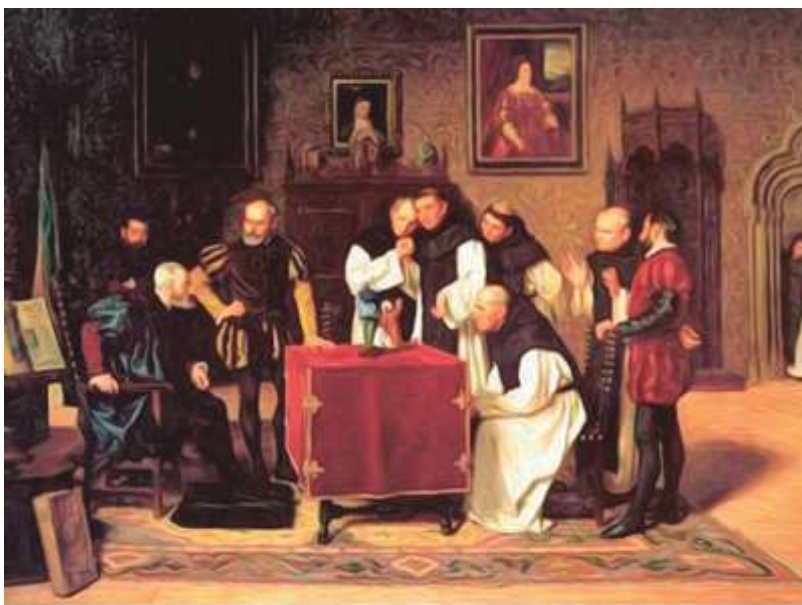
Real Consejo de Indias

organismo supremo de administración y control de toda la América Española. Su poder dimanaba del rey, y se ejercía en representación suya a través del presidente del Consejo, abarcando los poderes ejecutivo, legislativo y judicial. Aprobaba los nombramientos de altos cargos, dictaba leyes, influía en la designación de prelados, etc., y todos los funcionarios de la administración colonial debían rendir cuentas ante él.