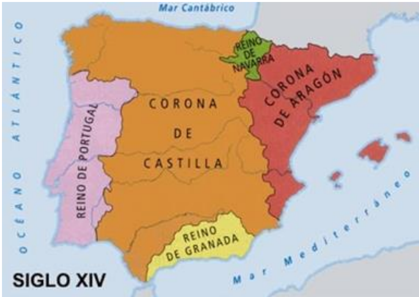
Reinos ibéricos. Siglo XIV

Cara y cruz. Así aparece la Europa cristiana frente a la península ibérica musulmana. Ignorante, ruda y sucia, la primera; floreciente la península en el siglo X, bajo el califa Abderramán III (912-961) con canalizaciones, multiplicación de regadíos, de molinos de agua y de viento. El campo es la residencia de la aristocracia, pero también de numerosos pequeños propietarios.