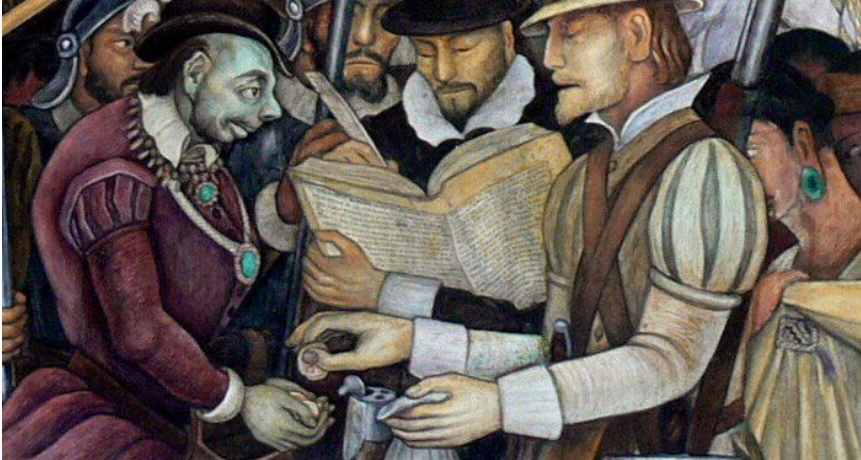
Mural de Diego Rivera, (Detalle)

C OMPRENDER a Nuestra América exige partir de la colonización. Es estrecha la relación entre el colonialismo y el mercantilismo . Cuando el comercio se traba por falta de medios de pago (deflación) hay sed de metales preciosos. Para los mercantilistas el oro y plata son la riqueza, “ la sangre de las naciones ”, lo que es parcialmente válido, mas no es toda la riqueza. Cada nación va por ellos. Y España los extrae a raudales de América. Por el monopolio comercial las colonias son obligadas a vender sus mercancías a bajo precio y a comprar las de la metrópoli a altos precios. La Corona se enriquece por el cobro de impuestos y los comerciantes españoles ganan. Las colonias se perjudican y reclaman libertad comercial. España la niega y las