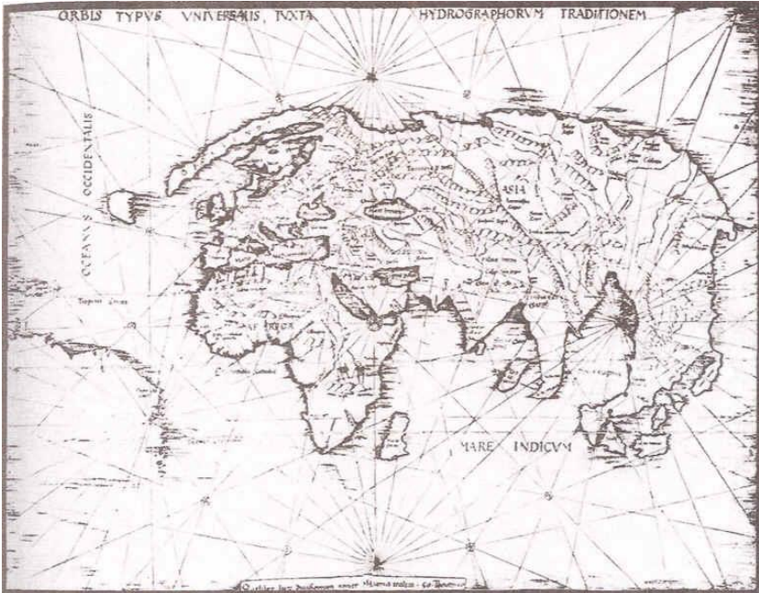
Mapa del mundo anterior al “descubrimiento” de América

S E analizará Europa brevemente hasta los viajes de Colón (1492). El Viejo Mundo comprende a Europa, Asia y África, con grados diferentes de desarrollo. En base a la técnica del riego, el modo de producción tributario fue revolucionario. Luego dio paso a 4.000 años de estancamiento técnico (-3000 a 1000). Ese estancamiento se ve atenuado con la divulgación del hierro. El hierro, que se utiliza desde el -3000, se populariza