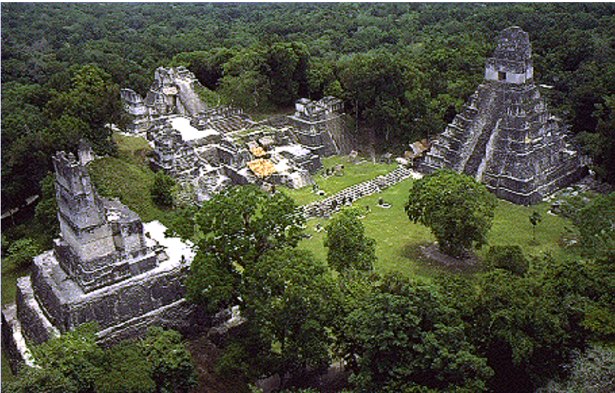
Civilización Maya. Tikal, Guatemala

En el área mexicana surge Teotihuacán por el Lago Texcoco y su apogeo es del 1 al 400; los toltecas, sus herederos, tienen la hegemonía entre 850 a 1050. Tras un lapso de nueva dispersión, los aztecas, procedentes del noroeste de México o sur de Estados Unidos actuales, llegan al lago Texcoco, fundan Tenochtitlán (1370) y mediante guerras se expanden por México Central y Guatemala actuales, aunque perduran zonas independientes hasta que llegan los españoles.