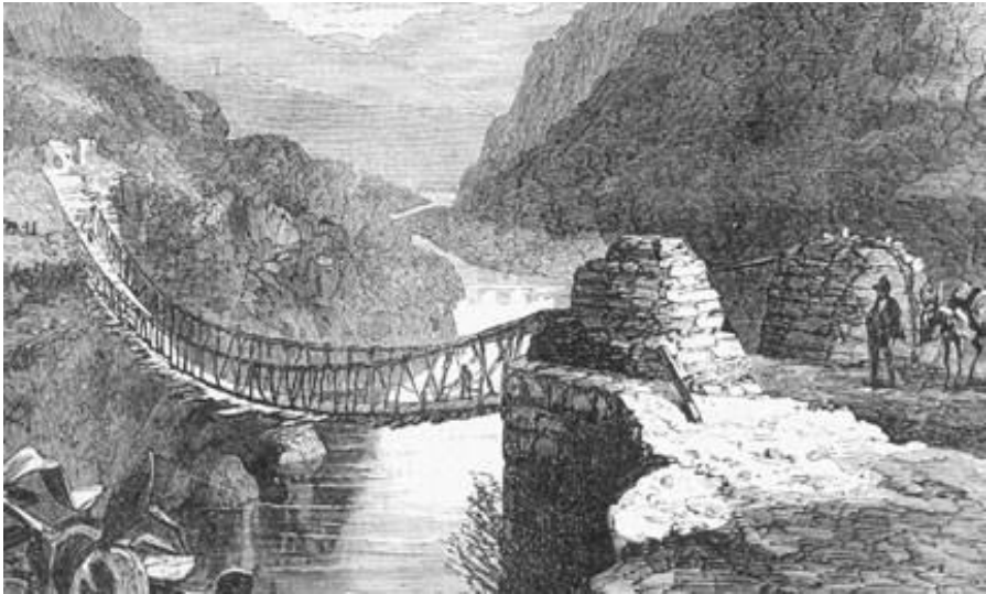
Puente colgante. Civilización Inca. Perú.

penetran en Chile, se apoderan de las islas Galápagos (1485) y territorios de Colombia actual (1498). Al llegar los españoles están en guerra el quiteño Atahualpa y el cuzqueño Huáscar.