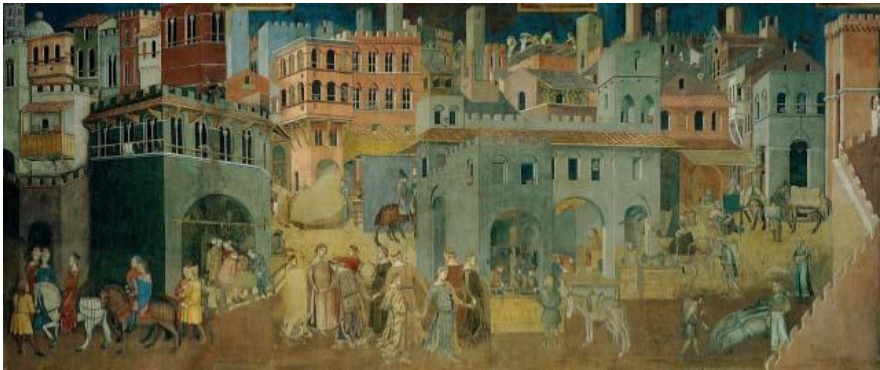
Siena (Italia), siglo XIV. Pintura de Hermanos Lorenzetti.

la carretilla mejora el transporte de carga. En el XIV se aplican las esclusas en los canales, lo que mejora la navegación fluvial. Todos allanan el camino de la Revolución Comercial, comenzada en el XII. Ésta constituye un período de expansión económica de Europa, y de la aparición del colonialismo y el mercantilismo. Hay factores tecnológicos que hemos señalado, geopolíticos y económicos: inflación, desarrollo de los bancos, sociedades anónimas, bolsas de valores, etc.