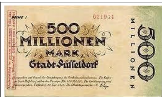
Hiperinflación en Alemania, 1923: Billete alemán de 500 millones de marcos

Cuando la hiperinflación llegó a Alemania en 1923 la gente intercambiaba con cigarros en vez de dinero. El dinero, por lo tanto, está ligado al valor real producido por los trabajadores. Como un pedazo de elástico, puede extenderse hasta cierto punto, pero eventualmente se retracta para equilibrar con el valor verdadero, medida por el trabajo de los trabajadores.