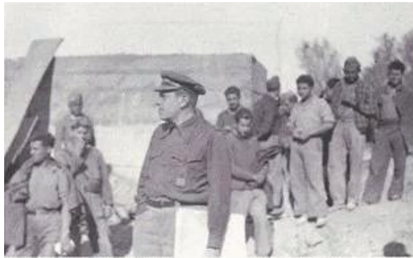
El alemán Comandante Hans fue uno de los más emblemáticos mandos de las Brigadas Internacionales. Participó, entre otras acciones militares, en las batallas de Guadalajara y del Ebro.